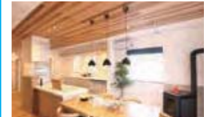
余裕の広さのアイランド型キッチン。ベレットストープの炎を楽しみながらのお食事も楽しめます。