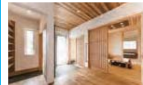
和室には秋田杉材の内装材・けいそう土の塗り壁を使用。消臭・調湿効果もあります。