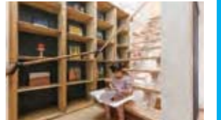
小屋裏収納に続くスケルトン階段。壁一面の棚に本を並べ、階段をライブラリースペースに。