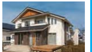
3世代みんなが快適に暮らせるよう、家族全員の目線考えた(CASATAII)優れた高気密高断熱住宅+太陽光発電で、大きな光熱費抑制効果が期待できる。58.9坪