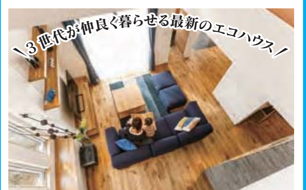
余計な間仕切りのない吹き抜けが特徴的な、開放的な空間。

まずはモデルハウスへ！ CASATA II 10:00~18:00 水曜日定休 ※時間外は、予約をお願いします。