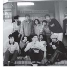
予備校時代(左)から続く鹽電神社への初詣。今年は並んで記念撮影(右)左から4人が同級生。