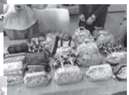
ハンドメイド作品