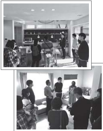
オーナー様を囲んで話をさいたり

今年は2軒のオーナー様宅を訪問して、実際住んでみての感想や住まい方、あたたかさ、家を建てるまでの悩み等々、オーナー様からしか聞けない話をじっくりと直接お伺いしてきました。