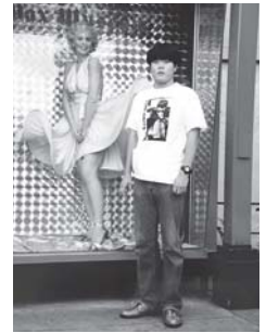
会長との初めての親子旅行。ロサンゼルスでのチャイニーズシアターにて。 (さぶちゃん奮戦記 P406より)

1973年生まれ、私の二十代と言えば、仙台で浪人生から始まりました。過去最高の競争率の中、勉強も程々に、今でもつながりのある友人や音楽との出会いもあり、充実した時間でした。振り返れば、後の人生を決めるものさしの原型は明らかにこの時期に出来たと言えるでしょう。挫折し、足踏みした時間も何十年も先に様々な形で実ることになります。中には自宅を建てることになった友人もいるのです。本当に夢にも思いませんでした・・・。