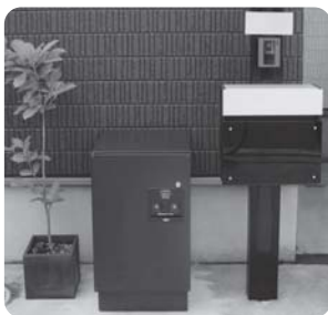
施工事例 Panasonic様「戸建て住宅用宅配ボックスコンボパンフレット」より

こちらのCOMBO (Panasonic) という商品は、電気工事不要で取り付けも簡単にでき、押印も可能! 据え置き施工用ベースと併せて、 限定2台を約50%OFFの51,650円(税抜) でご提供致します! さらに今なら標準工事費がサービス! この機会に導入を検討してみたいかがでしょうか。