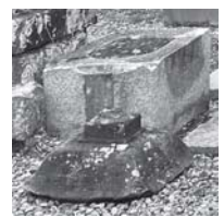
手水舎 大切に保存しようと思 います。

皆と揃って記念撮影をしたのちに、隣にあった手水舎(水がめ)にふと目をやると祖父の名を発見。もう一人のお名前もあり、仲間と二人でつくったのでしょうか。私はもちろん、家族も誰も知らされておらず大きな発見となりました。これもご利益だと感じながら完成まで努めてまいります。