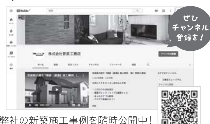
弊社の新築施工事例を随時公開中!