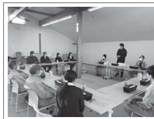
全員マスク姿は独特な光景ですよ(笑)