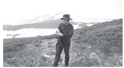
去年の連休、雪が残る栗駒山

皆様、お変わりないでしょうか。こんなご時世ではありますが、新緑の季節、春の訪れとあわせて、東北・宮城に住む私たちが一年で最も過ごしやすく爽やかな時期になりました。