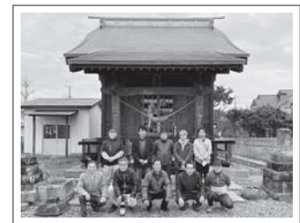
集合写真 (向かって左が手水舎)

私はお墓参りに歩いて行くたびに、東日本大震災で被害をうけた近所の神社の鳥居がそのままになっていたことが気がかけていました。