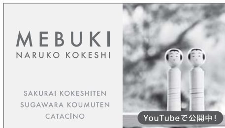
MEBUKI こけし YouTubeチャンネル「工務店ミュージアム」で公開中。