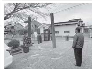
鳥居 (李埜八幡神社にて)