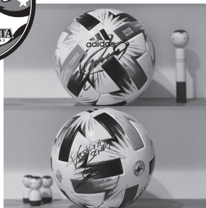
サイン入りボール