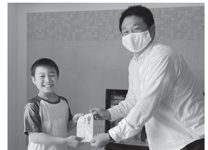
社長から授与 おめでとうございます!