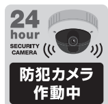
防犯カメラ撮影中のシール

最近では防犯カメラも非常に安く、スマホなどで離れた位置からでも映像を見れたりできます。(コストコで見かけたQ-SEEもレビューでは高評価!)