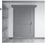
ロフトに設置したどこでもドア? (弊社施工例より)