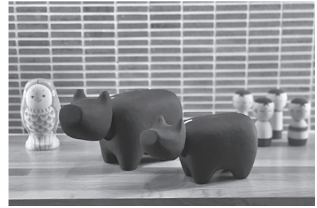
モデルハウスの黒ベコ、お気に入りです。