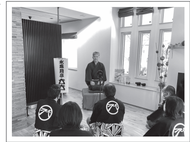
今回はスタッフが客席で楽しみました。