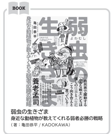
弱虫の生きざま 身近な動植物が教えてくれる弱者必勝の戦略 (著：亀田恭平 / KADOKAWA)

身近な自然、生きもの達を知ることで、視点が変わり生きるヒントまで得られます。ちょっとしたリフレッシュにもなるので皆さんも楽しんでみてはいかがでしょうか。