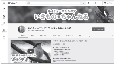
「ネイチャーエンジニア いきものちゃんねる」

最近ハマっているYouTube動画があります。「ネイチャーエンジニア いきものちゃんねる」