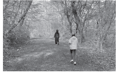
身近な自然を楽しむきっかけになっています。