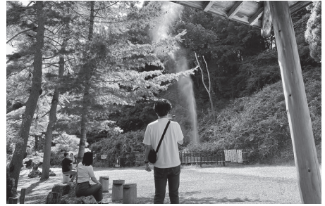
1) 鬼首かんげつ泉 小学3年生の時の遠足の思い出の場所

菅原工務店の50周年を前にショールームで準備を進めている「工務店ミュージアム」では「大崎を、学ぶ、つなぐ」をテーマに、地域の気候や風土をお客様と一緒に楽しみながら暮らしの知恵から防災に至るまで共有していく事を目的としています。