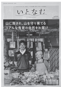
3) 大崎市のフリーペーパーにも登場している大久商店さま

通り道にある地元のお店では、その水神の碑には毎年古川の方から、豊かな水に感謝し、お米の豊作を祈願する方たちが絶えないというお話も伺うことが出来ました。あわせて生々しい「熊」の目撃情報も！(写真3)