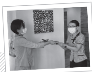
東北電力県北営業所所長様より

これもひとえに皆様のおかげです。今後もより一層皆様のお役に立てるよう頑張っていきますので宜しくお願い致します!!