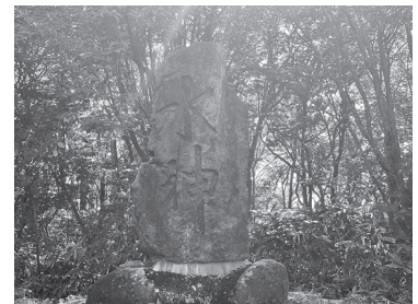
2) 江合川の源流の碑となっている「水神」碑

先日、途中、最近人気の吹上のキャンプ場や鬼首のかんげつ泉(写真1)にも久しぶりに立ち寄りながら、さっそくその水源とされる荒雄岳にある水神の碑を訪れました。(写真2) 栗駒山や禿岳などへの登山経験はありましたが、江合川の水源がどこになるかは恥ずかしながら知りませんでした。