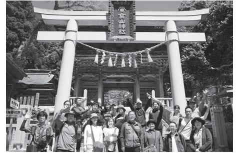
金華山でみんな揃って記念写真

菅原工務店50周年を記念して「大崎を学ぶ・つなげる」をテーマに秋にオープン予定の工務店ミュージアム。その取り組みの一つとして、社内研修を先日開催しました。テーマは「江合川と黄金を辿る金華山旅」。