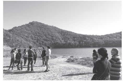
潟沼の紅葉も私のお気に入り。

秋が深まる中、地元では紅葉の話題が栗駒山から徐々に鳴子峡へと変わっていく時期です。