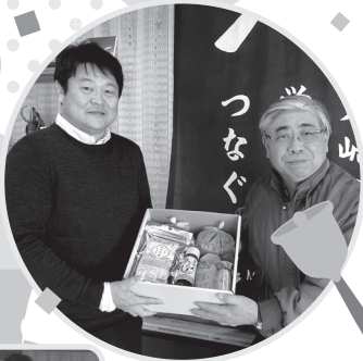
大崎特産賞 大崎市 N 様に贈呈