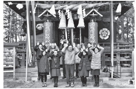
祇園八坂神社へ新年の安全祈願