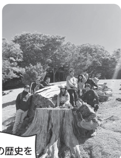
太古の歴史を感じる巨木